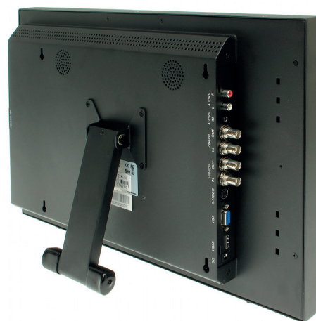
kompaktní polohovatelný stojan